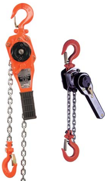
Nitchi RB-5 0,8t Nitchi RB-5 0,25t